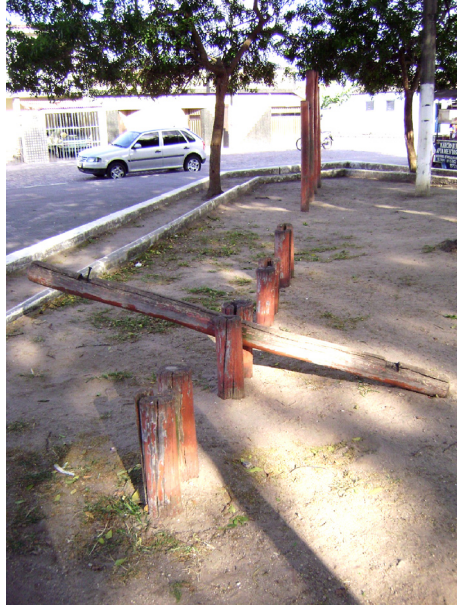
Imagem 04: Praça Joana D'Arc – playground, brinquedos depredados.